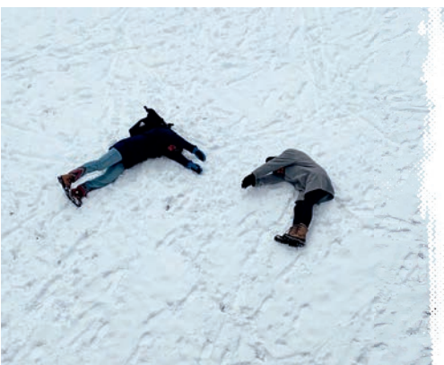
Zugegeben, auch wir hatten unseren Spaß.

Das sind die Almigos und Almigas voll in Action!