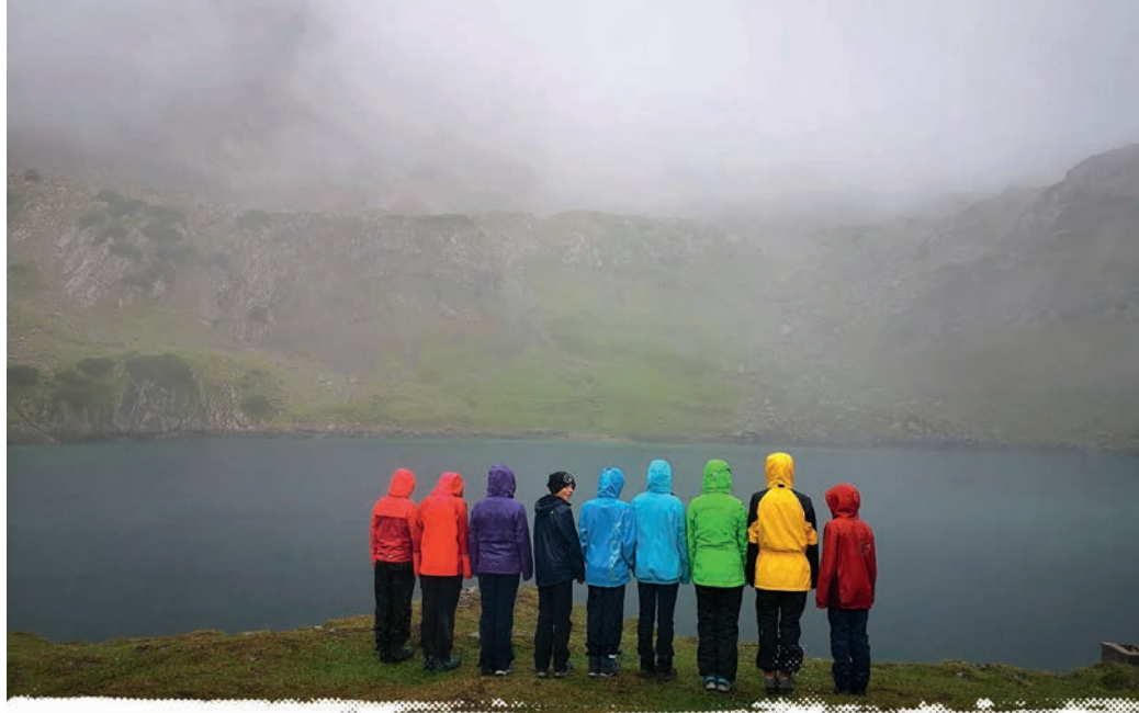
Gegen Vernebelungen aller Art hilft Farbe: Unsere Jugend ist bunt.

nach Geschlechtergerechtigkeit vollumfänglich in der Sprache umzusetzen. Das oben bereits angesprochene Positionspapier der jdav beginnt mit der Aussage „Menschen sind unterschiedlich, in allem, was sie ausmacht.“ Unsere DAV-Jugend sieht sich als vielfältig an, sei es in Bezug auf Interessen, Wünsche oder eben die geschlechtliche Identität. Dabei verneinen wir keineswegs das biologische Geschlecht (engl. sex), sondern bejahen gleichzeitig das Vorhandensein des sozialen Geschlechts (engl. gender). Das bedeutet, dass wir die vorherrschende Geschlechterordnung in der Gesellschaft, die ausschließlich „Frau“ und „Mann“ kennt, verändern wollen. Über den Genderstern sollen alle Menschen eingeschlossen werden, die sich in keinem dieser beiden Geschlechter wiederfinden. Damit soll auch dem Recht auf geschlechtliche und sexuelle Selbstbestimmung sowie dem Anspruch auf individuelle Persönlichkeitsentwicklung Rechnung getragen werden.