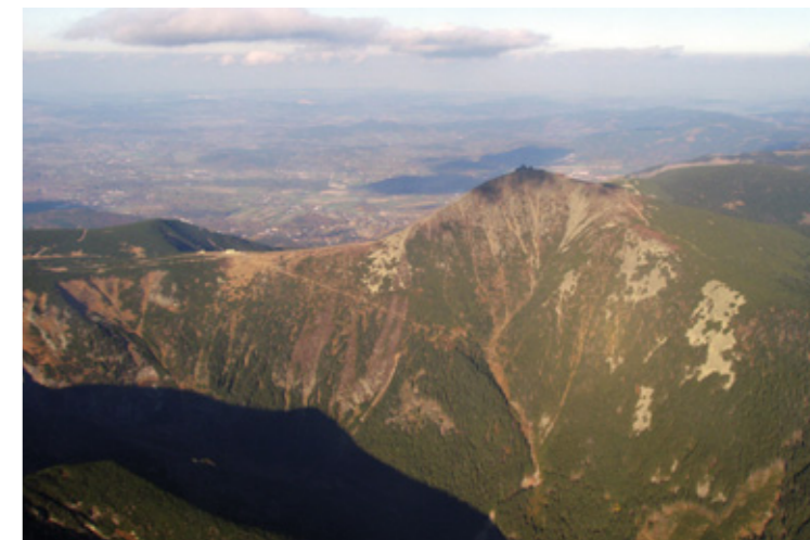
Obří důl (Riesengrund) mit der Schneekoppe, dem höchsten Berg des Riesengebirges

Karten/Führer: ROSY-Wanderkarte „CHKO Jizerské Hory“ 1:25 000; Klub-Českých-Turistů-Wanderkarte 20–21 „Jizerské hory a Frýdlantsko“ 1:50 000, Pollmann, Riesengebirge mit Isergebirge (Rother 2015)