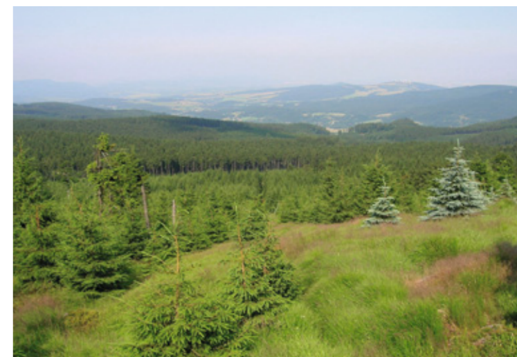
Blick vom Gipfel „Olivetská hora“ über das Isergebirge