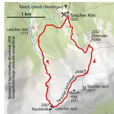
© alpinwelt 3/2020, Text & Foto: Markus Meier

Richtung bergab. Ein paar Skihütten passierend gelangt man zu einer Wegeteilung. Man geht nun nicht weiter in Richtung Latscher Alm, sondern biegt nach rechts ab. Der Weg Nr. 9 führt nun zurück zur Tarscher Alm, wo man in einem der beiden Berggasthäuser noch gemütlich einkehren kann. Anschließend fährt man mit dem Sessellift wieder zurück ins Tal.