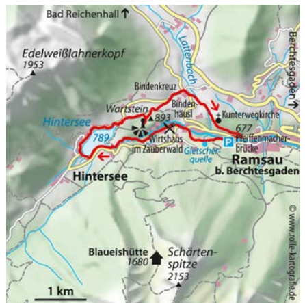
© alpinwelt 3/2020, Text & Foto: Siegfried Garnweidner

ab, führt gering abfallend bis zu einem Querweg. Hier nach Nordosten weiter, quer über einen Wiesenhang hinunter und auf der Triebenbachstraße zum Bindenkreuz. Dort nach rechts auf die Alte Reichenhaller Straße einbiegen, hinter dem Bindenhäusl nach links durch ein Weidegatter und zur Kunterwegkirche. Dann auf dem Wallfahrerweg nach Ramsau hinab und zum Ausgangspunkt zurück.