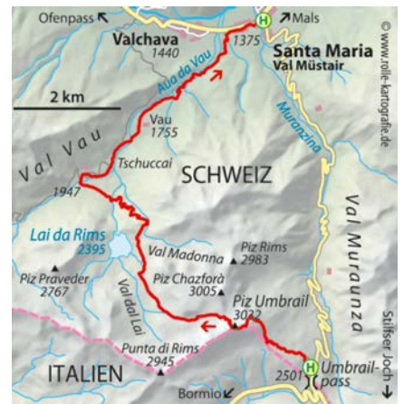
© alpinwelt 3/2020, Text & Foto: Andrea & Andreas Strauß

Im Umbrail-Anstieg wird auf Infotafeln die Geschichte des Ersten Weltkriegs aufgearbeitet, als Österreich und Italien das Stilfser Joch umkämpften und Schweizer als