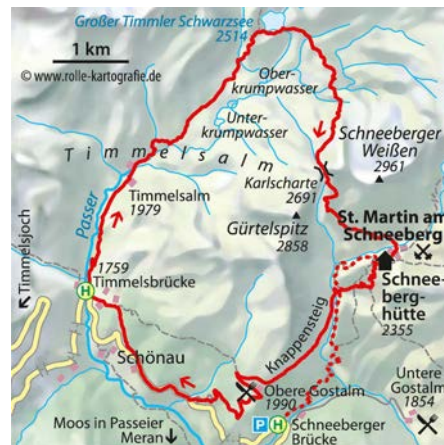
© alpinwelt 3/2020, Text & Foto: Franziska Baumann

Variante: Kürzester Zustieg zum ehemaligen Bergwerk von der „Schneeberger Brücke“ in einer Linkskurve der Timmelsjochstraße (Parkplatz u. Bushaltestelle, ↗ 2 Std.)