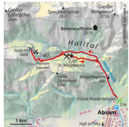
© alpinwelt 3/2020, Text & Foto: Nadine Ormo

St. Magdalena wählen. Von dort weiter durch den Wald, bis man wieder auf den Fahrweg kommt und zum Ausgangspunkt zurückgeht. Wer den Ausflug ausweiten möchte, der kann den Solewanderweg mit einer Übernachtung auf der Bettelwurfhütte (2079) und einer Runde auf die Speckkarspitze (Bergtour) kombinieren.